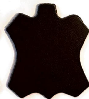
TESTA DI MORO